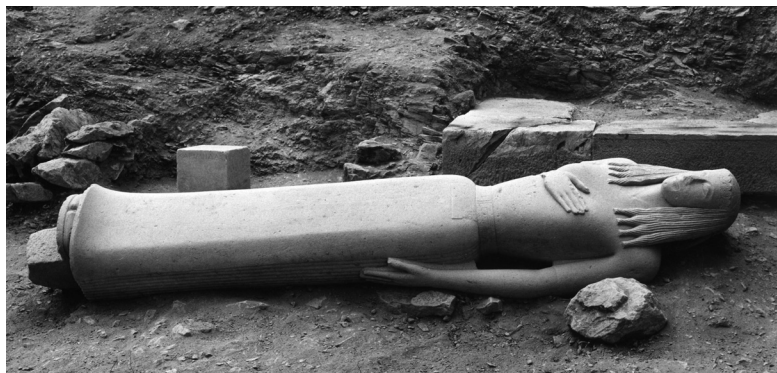
Εικ. 11. Αρχαία Θήρα. Η μαρμάρινη δαιδαλική κόρη, όπως βρέθηκε στο νεκροταφείο της πόλης στη Σελλάδα.

Στη Δήλο ανοίχθηκε η λεωφόρος των Λεόντων μέχρι το αρχαϊκό λιμάνι του Σκαρδανά και ανασκάφηκε μια αγορά της αρχαίας πόλης και πολλά καταστήματα και εργαστήρια. Στο εργαστήριο ενός χρυσοκόου βρέθηκαν χρυσά κοσμήματα των αρχών του 1ου αι. π.Χ. (εικ. 10). Στη Μήλο , στη θέση «Κλήμα», όπου τοποθετείται το λιμάνι της αρχαίας πόλης, ήλθαν στο φως δύο μεγάλα οικοδομικά συγκροτήματα με επάλληλες οικοδομικές