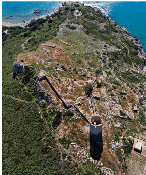
Εικ. 16. Δράκανο Ικαρίας. Γενική άποψη της οχυρωμένης ακρόπολης με τον κυκλικό πύργο.

Στο βραχώδες ακρωτήριο Δράκανο της Ικαρίας υπάρχει οχυρωματική εγκατάσταση, στην οποία δεσπόζει κυκλικός πύργος, που πιθανόν χρονολογείται στον 5ο αι. π.Χ., σωζ. ύψ. 12,95 μ. (εικ. 16). Οι ανασκαφικές εργασίες εντός του χώρου της ακρόπολης έφεραν στο φως ιερό των Ειλειθυϊών σύμφωνα με επιγραφή, σειρά άλλων μονόχωρων και δίχωρων κτηρίων λατρευτικού χαρακτήρα με έξοχα αναθή-