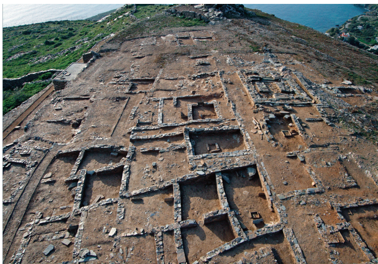
Εικ. 9. Υψηλή Άνδρου. Το ιερό και συνοικία της αρχαϊκής φάσης της ακρόπολης.

Επιπλέον, ανασκάφηκε εκτεταμένο νεκροταφείο αρχαϊκών και κλασικών χρόνων στην ευρύτερη περιοχή της Κορρησίας Κέας και συνεχίστηκε η ανασκαφή του νεκροταφείου της αρχαίας Οίας , του βόρειου επινεϊού της αρχαίας Θήρας και εκείνου της αρχαίας πόλης της Κύθνου . Κατά την ανασκαφή τάφου στο νεκροταφείο της αρχαίας Θήρας , στη νοτιοδυτική Σελλάδα αποκαλύφθηκε μαρμάρινη δαιδαλική κόρη υπερφυσικού μεγέθους, ύψ. 2,30 μ. (εικ. 11). Το μοναδικό αυτό άγαλμα, που είναι ήδη γνωστό ως η κόρη της Θήρας και χρονολογείται κατά τον ανασκαφέα στο β' μισό του 7ου αι. π.Χ., ανοίγει ένα νέο κεφάλαιο στην ιστορία της αρχαϊκής πλαστικής.