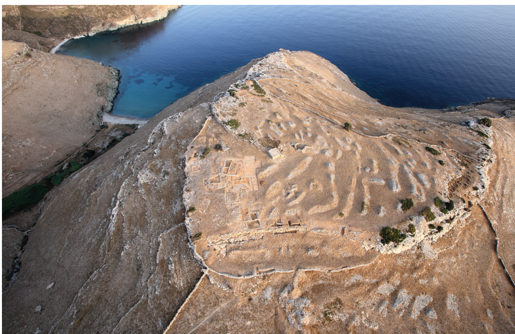
Εικ. 1. Στρόφιλας Άνδρου. Ο οικισμός της Τελικής Νεολιθικής περιόδου.

Η ανασκαφική έρευνα της τελευταίας δεκαετίας έδειξε ότι ο αξιολογότερος οικισμός του Στρόφιλα Άνδρου , που χρονολογείται στην Τελική Νεολιθική εποχή, έχει έκταση 20 στρεμμάτων περίπου, προστατεύεται από ισχυρό τείχος και διαθέτει μεγάλα οικοδομήματα, καθώς και οργανωμένο ιερό. Ιδιαίτερο εύρημα αποτελούν οι εκτεταμένες επίκρουστες ή σκαλιστές βραχογραφίες που κοσμούν το τείχος, το δάπεδο του ιερού και μέρη του βράχου κατά μήκος του τείχους (εικ. 1) με παραστάσεις φυσιοκρατικές (ζώα, ψάρια και πάνω από 60 πλοία) και συμβολικές (σπείρες, δακτυλιόσχημα θέματα στο σχήμα των νεολιθικών ειδωλίων). Ο Στρόφιλας, όπως και ο σύγχρονός του μεγάλος οικισμός που επισημάνθηκε στον Άγιο Γεώργιο Φαλατάδου στην Τήνο, καταδεικνύουν ότι ήδη από την 4η χιλιετία π.Χ. αναπτύχθηκαν στις βορειο-ανατολικές Κυκλάδες οργανωμένες κοινωνίες