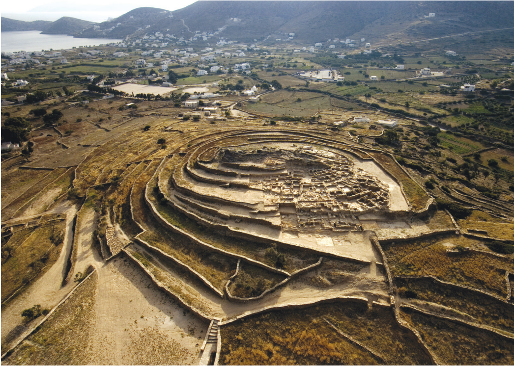
Εικ. 2. Σκάρκος Ίου. Γενική άποψη του λόφου του Σκάρκου με τον πρωτοκυκλαδικό οικισμό.

προδρομικές των πρωτοκυκλαδικών κοινωνιών της 3ης χιλιετίας π.Χ.