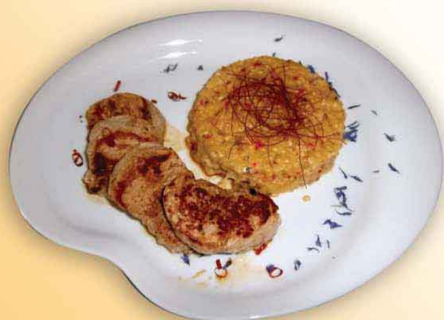
Από τον Chef της Vita Epsilon Συμεών Χαλκιά