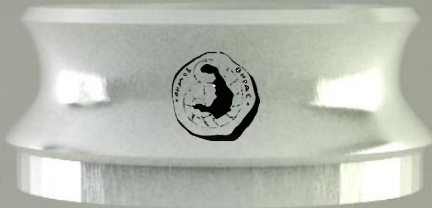
Λογότυπος δήμου θήρας