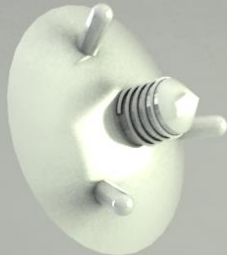
δοχείο συγκέντρωσης λυμμάτων βίδωμα στο έδαφος